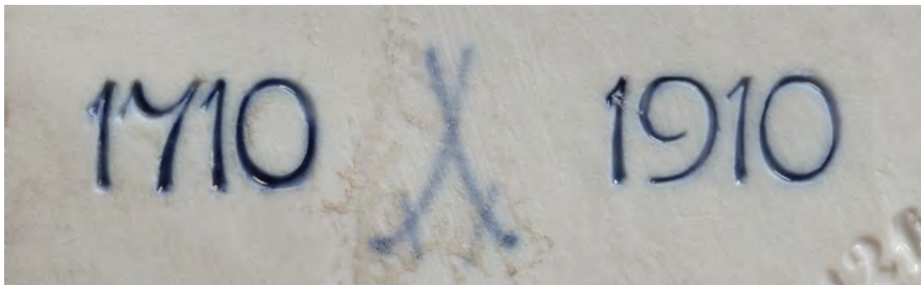
Юбилейная марка в честь 200-летия Мейсена. Основана мануфактура в 1710

Два синих скрещенных меча Мейсенского фарфора неизменно с 1722 года являются самой известной в мире экспортной торговой маркой, прославившей Саксонию. Исторически маркграфство Мейсен — часть курфюршества Саксония, с 1356 по 1806 годы входившее в состав Священной Римской империи. Саксонские курфюрсты по закону «Золотой буллы» после смерти императора Священной Римской империи и до избрания нового являлись эрцмаршалами и на церемонии коронации императора должны были нести имперские мечи. В знак этой высокой чести на гербе и флаге курфюршества Саксония изображались два красных скрещенных меча. Перенесенный на фарфор геральдический знак Саксонии стал символом высочайшего художественного уровня и качества фарфора, знаком привилегированного общественного положения его обладателей.